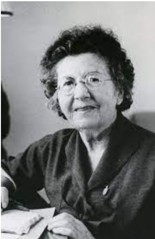
רחל ינאית בן צבי

https://www.hamichlol.org.il/%D7%A8%D7%97%D7%9C %D7%99%D7%A0%D7%90%D7%99%D7%AA %D7%91%D7%9F-%D7%A6%D7%91%D7%99